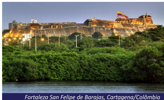
Fortaleza San Felipe de Barajas, Cartagena/Colômbia