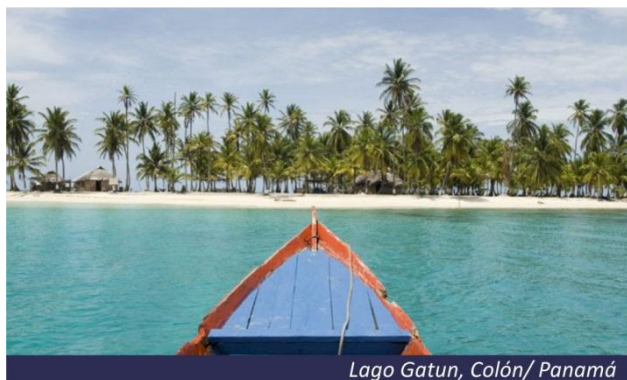
Lago Gatun, Colón/Panamá

Chegada, desembarque e traslado para a Cidade do Panamá com parada para tour de compras.