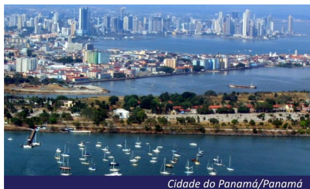
Cidade do Panamá/Panamá

Panamá (Cidade do Panamá, Colón), Colômbia (Cartagena das Índias), Curaçao , Bonaire (Países Baixos Caribenhos), Aruba